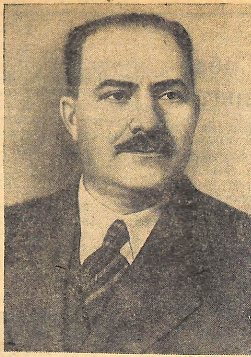
Лазар Мойсейович КАГАНОВИЧ