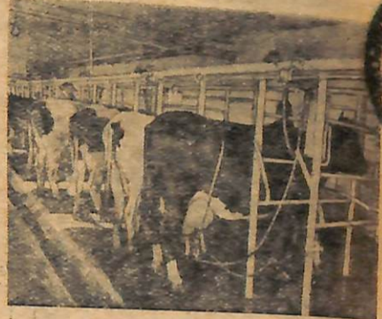
На фото праворуч: молочно-доїльний зал. Його стіни облицьовані білим кафелем. В залі встановлено спеціальні агрегати для механізованого доїння корів. Ліворуч — у новому свинарнику.