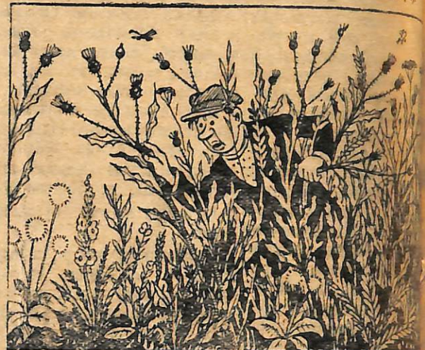
БУРЯКІН.—Здається, десь тут сів я кукурудзу.