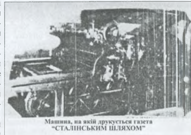
Машини, на якій друкується газета "СТАЛІНСЬКИМ ШЛЯХОМ"