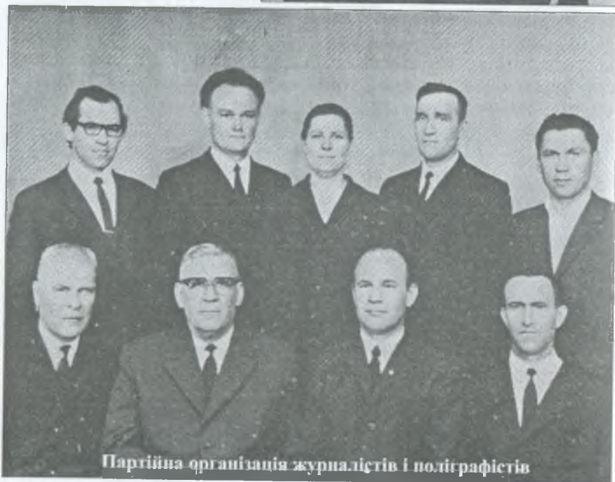
Партійна організація журналістів і поліграфістів