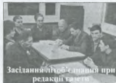
Засідання літоб'єстання при редакції газети