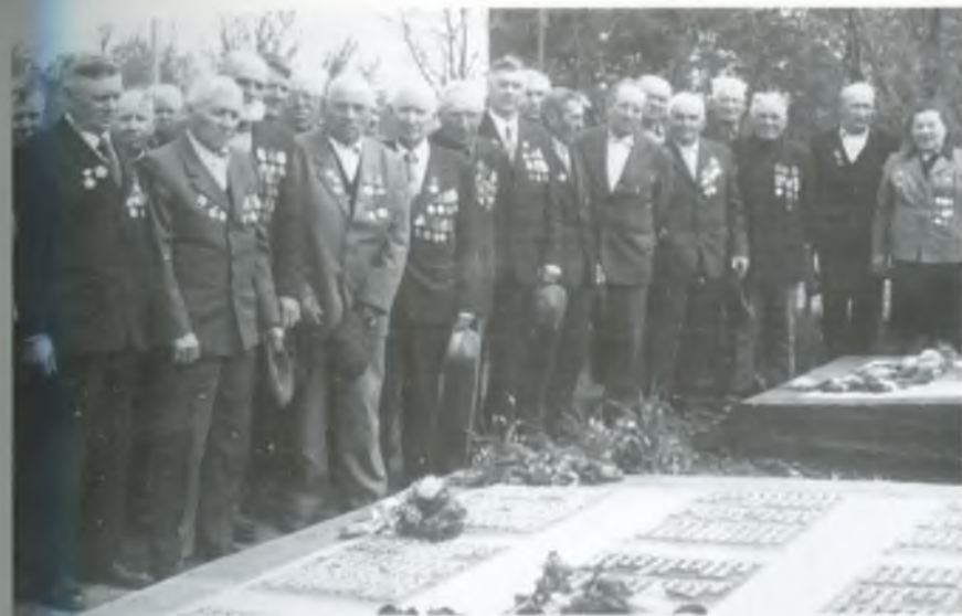
Ветерани Великої Вітчизняної війни села на меморіалі Слави 9 травня 1990 року.