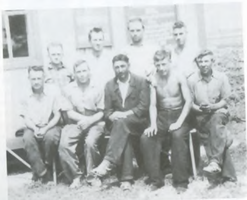
Колектив тракторної бригади № 3. 1954 рік.