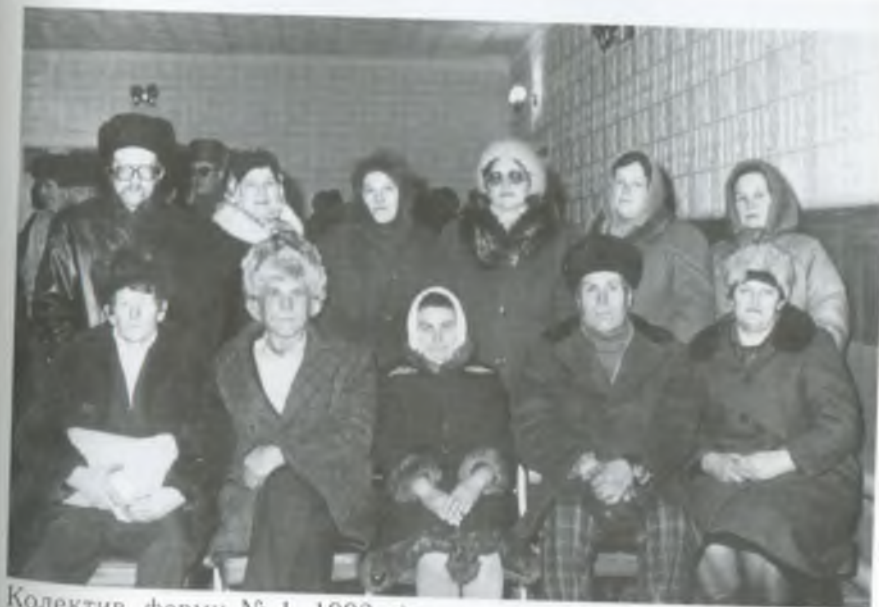
Колектив ферми № 1. 1993 рік.