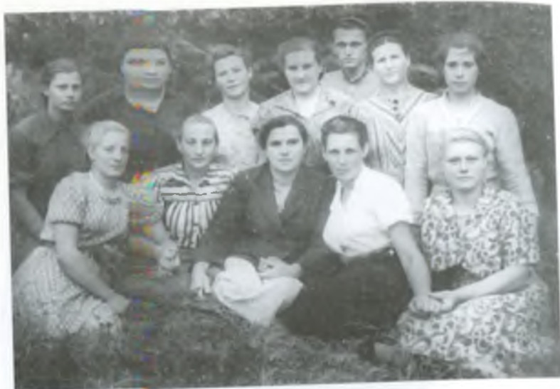
Доярки ферми № 3. 1959 рік.