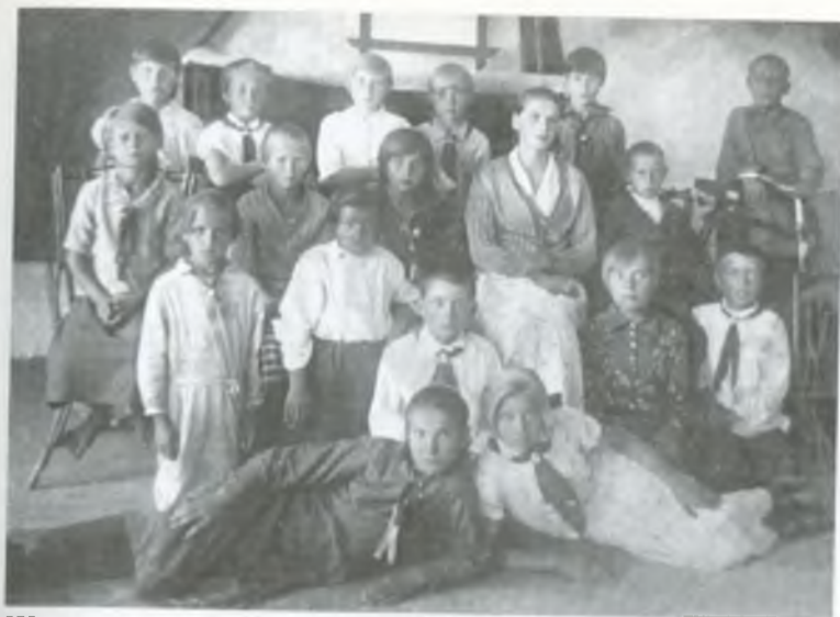
Шостий клас Хвалибогівської школи із своєю вчителькою, 1936 рік.