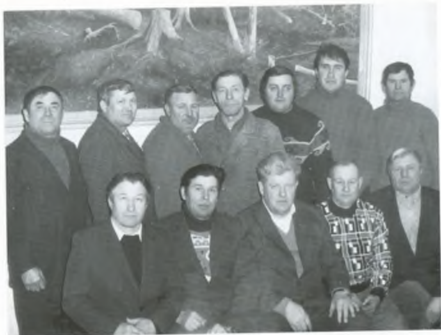
Колектив тракторної бригади № 1. 1993 рік.