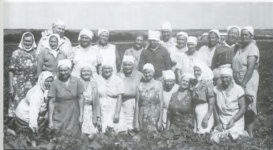
Бригада овочівників. 1990 рік.