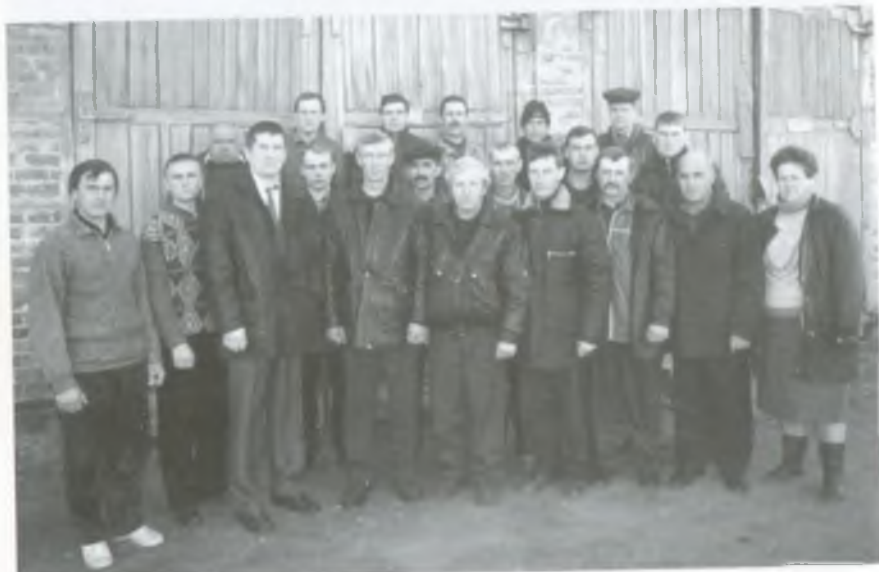
Колектив автогаража. 2003 рік.