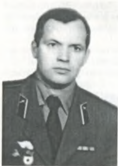
Полковник Володимир Пилипович Недеря