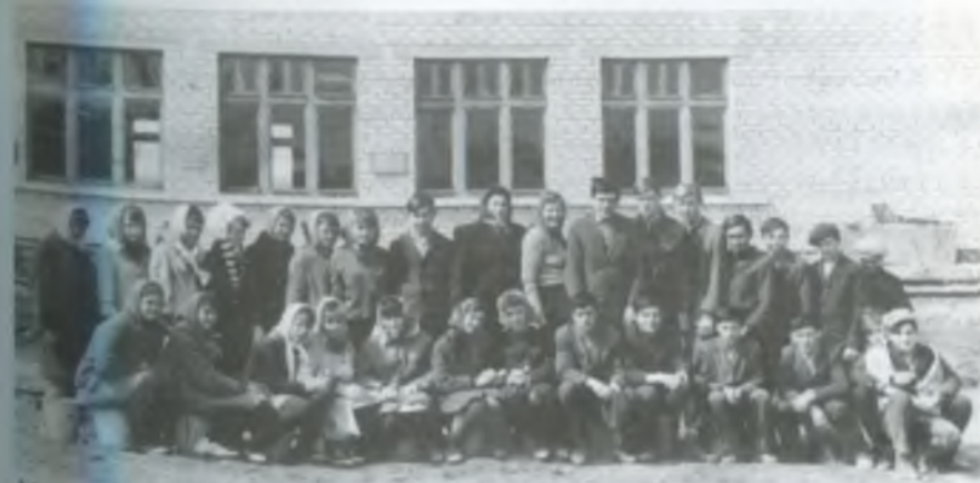
Молодь села на суботнику під час спорудження Добропільської середньої школи. 1969 рік.