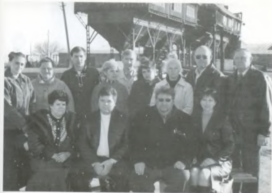
Колектив механізованого току. 2003 рік.