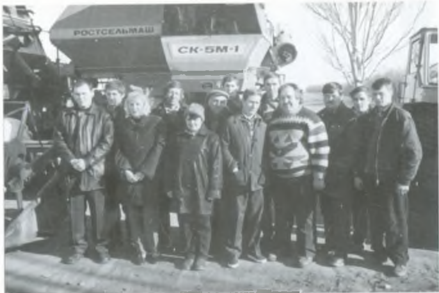
Колектив тракторної бригади № 2. 2003 рік.