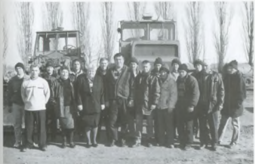
Колектив тракторної бригади № 1. 2003 рік.