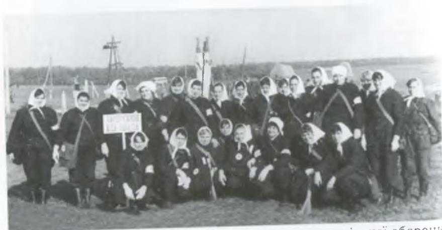
Санітарна дружина колгоспу – призер змагань з цивільної оборони (II місце). 1981 рік.