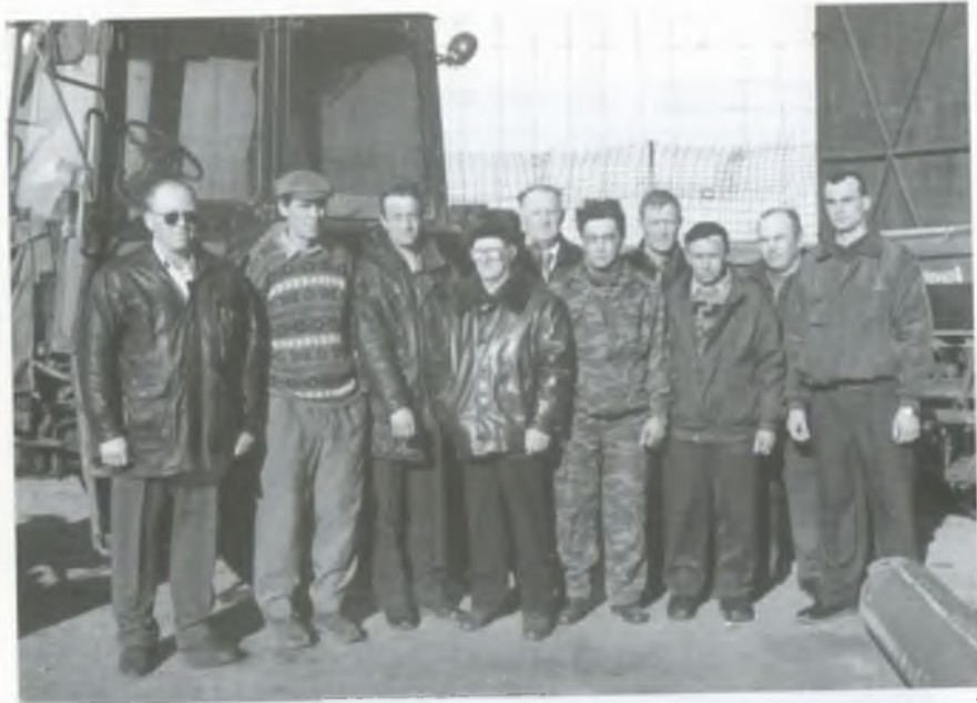
Колектив механічної майстерні, електрики з керівництвом галузі механізації. 2003 рік.