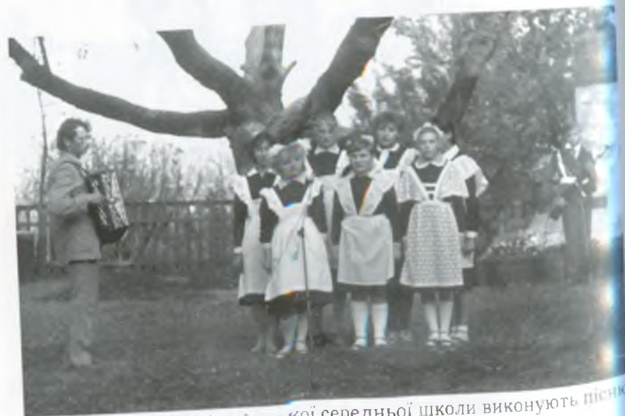
Десятикласники Добропільської середньої школи виконують пісню, присвячену ветеранам-землякам. 9 травня 1990 року.