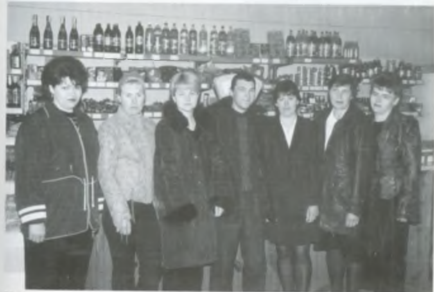
Колектив торгового підприємства ТОВ «Перемога». 2003 рік.