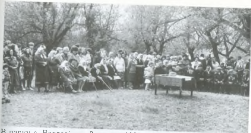
В парку с. Варварівки. 9 травня 1989 рік.