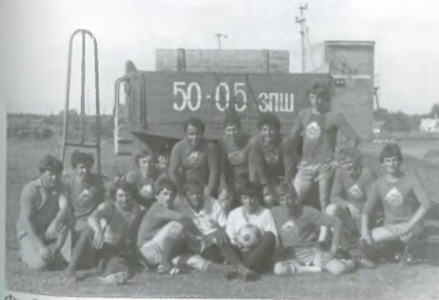
Футбольна команда колгоспу «Перемога». 70-ті роки.