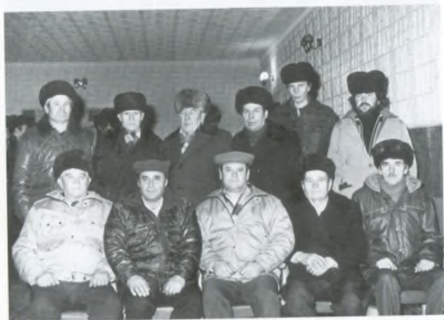
Колектив будівельної бригади. 1994 рік.