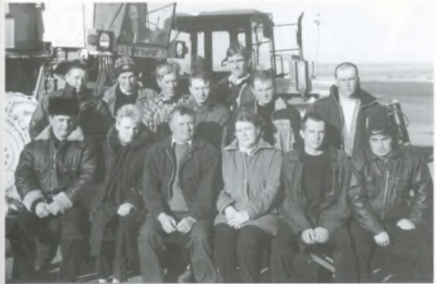
Колектив тракторної бригади № 4. 2003 рік.