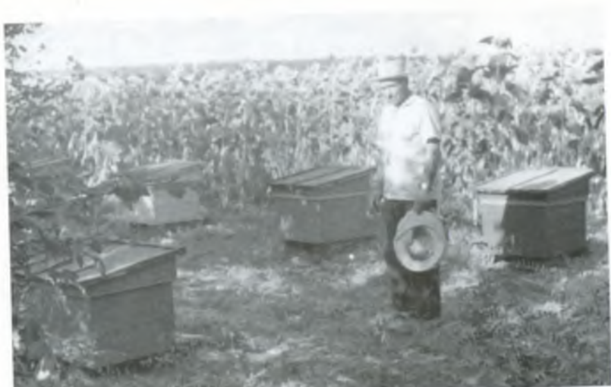
Пасічник Куш Григорій Єпіфанович. Липень 1970 року.