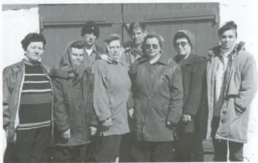
Колектив ферми № 1. 2003 рік.