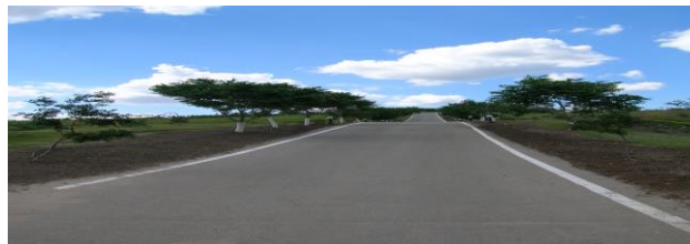
Главный подъём к Мемориалу