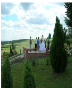
Неизменный букет – к Сломанной розе...