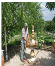
Родник из земных глубин