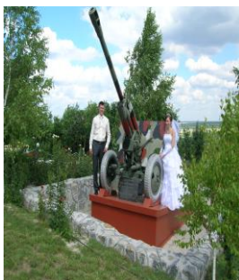
Молодожёны улыбаются беспечно и счастливо